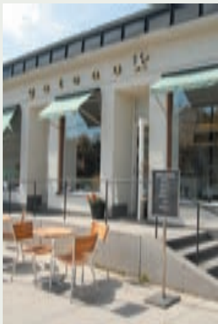
En caffè latte i solgasset.