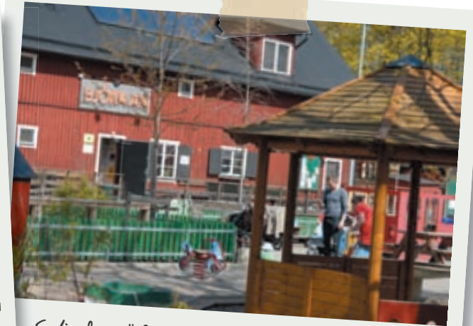
Solig dag i "Björkan".