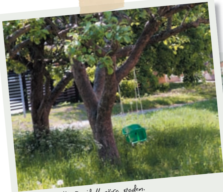
Lindarnas allé. En idyll nära staden.