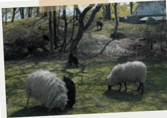
4-11 gården i Björklunds hage.

DÅ VAR BARNEN i säng och jag känner att jag själv börjar gäspa. Dags att krypa till kojs. Drar ner rullgardinen och tänker att det har varit en bra dag. En bra dag här i mitt fina Beckomberga.