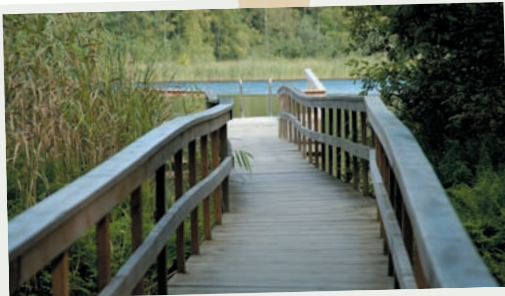
Kyrksjön. Ett promenadstråk. Bada på sommaren och åka skridsko på vintern.