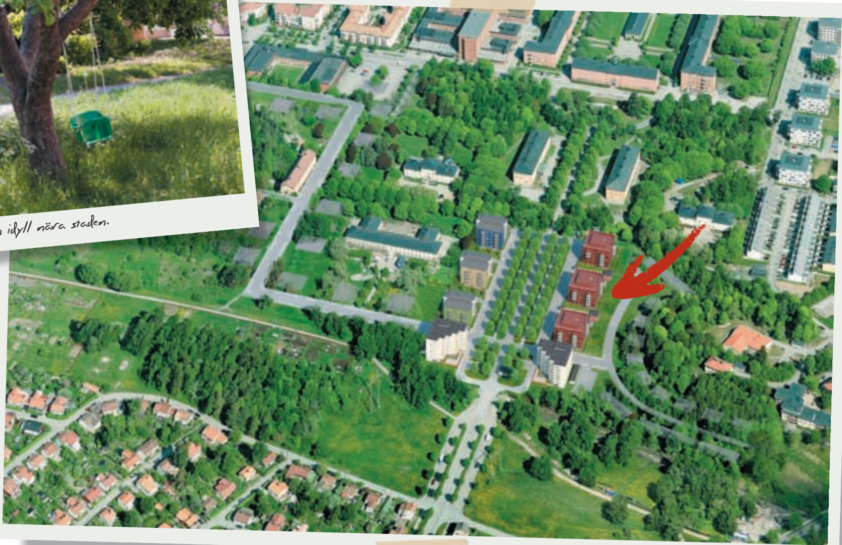
Obs! Bilden är en illustration.