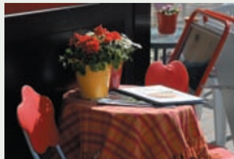
Hem ljuva hem.