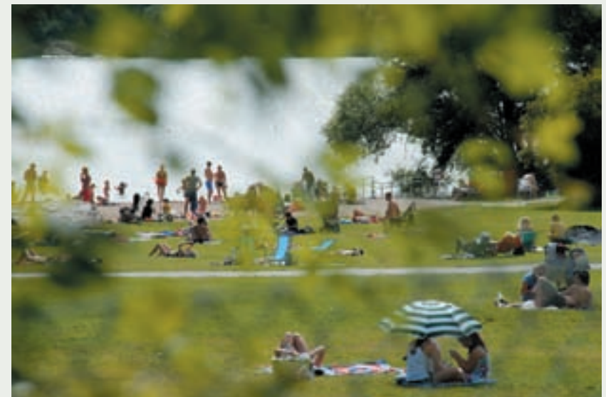
En härlig dag på Ängbybadet.