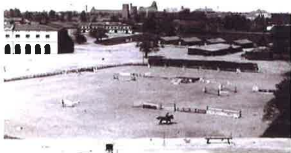
Utsikt från Skeppargatan 79 gårdssida under slutet av 1930-talet

Föreningen bildades den 12 oktober 1931 och registrerades av Länsstyrelsen den 17 februari 1932. Föreningens organisationsnummer är 702001-5017.