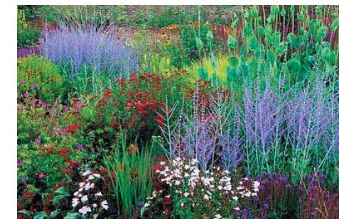
Perennplanteringar som blommar sommar + höst, med kompletterande vårlökar i en axel centralt på gården