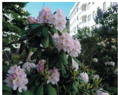
Våra rhododendron flyttas undan, sparas och återplanteras