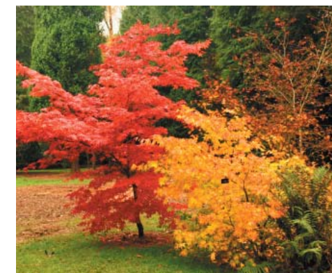
Buskar och träd med vackra höstfärger