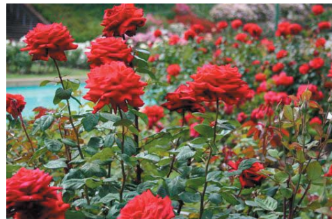
Röda rosor med underplantering av perenner längs husfasaderna på gårdshuset och huset vid Celsiusgatan