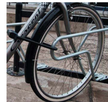
Nya cykelställen med möjlighet att låsa fast cyklarna

Järnvägsmannens nya gård bär likheter med den gamla men innehåller en hel del nyheter. Uteplatserna är placerade i ungefär samma läge som innan, liksom de nya träden. Alla träd är dock efter renoveringen placerade på väggar och pelare i garaget under gården för att avlasta bjälklaget. Längs gårdshusets fasad och längs huset vid Celsiusgatan planteras röda rosor, vilket har funnits på gården åtminstone från 1960-talet, men troligtvis ända sedan föreningen bildades på 1930-talet. Nya sittbänkar av trä placeras på kanten av de upphöjda planteringarna. Centralt på gården bildas en axel av storvuxna perenner och prydnadsgräs som tillsammans med vårlökar, blommande träd och buskar med vackra bladfärger på hösten ger gården färg under en stor del av året. Våra rhododendron återplanteras och ger gården en vintergrön stomme. De gamla cykelställena byts ut mot nya där cyklarna får bättre plats, och där det går att låsa fast cyklarna. Vi skapar också plats för fler cyklar inne på gården.