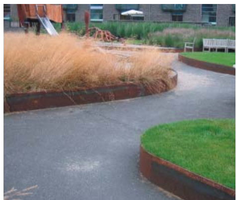
Kanter av corténstål runt planteringar och gräsmatta