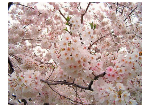
Buskar och träd (bl.a. körsbärsträd och magnolia) med ymnig vårblooming