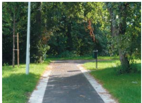
Markbeläggning av betongmarksten och asfalt