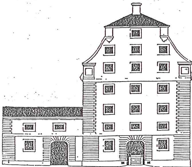
Faciat af S:t. R.S.S. / 4:4 Gec. by G. J. J.