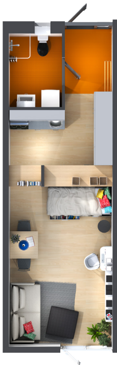
Lägenhet 1 - 34,5 kvm