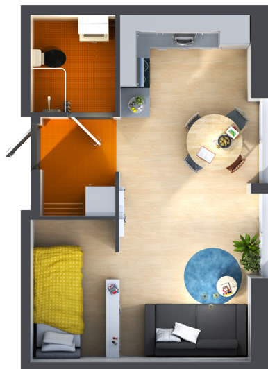
Lägenhet 2 - 30,5 kvm