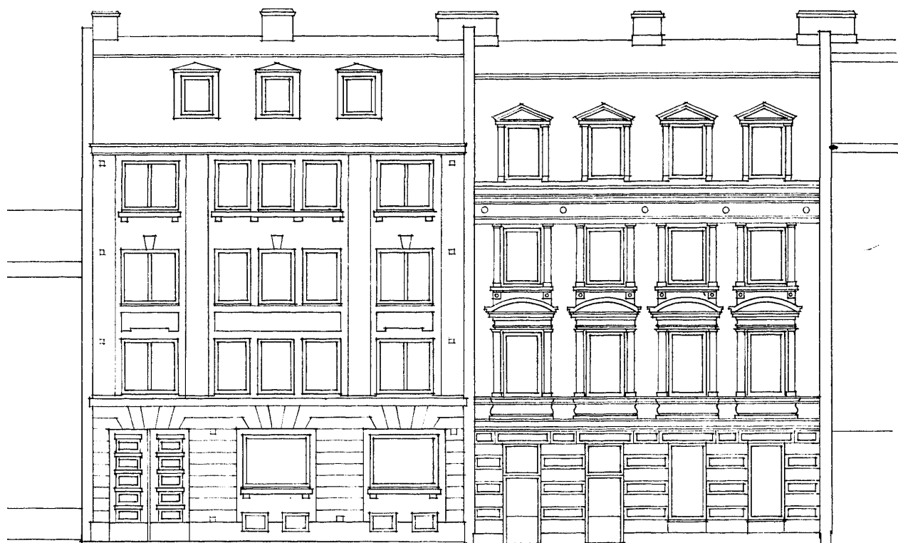
FASAD MOT SÖDER/KYRKOGATAN

Stadgar för Bostadsrättsföreningen Kyrkogatan i Göteborg, Göteborgs kommun, organisationsnummer 769609-6366