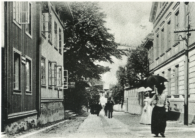
Långgatan norrut, till höger Rådhuset, till vänster nummer 15 ( närmast kameran) och nummer 13. Bilden tagen cirka 1900.