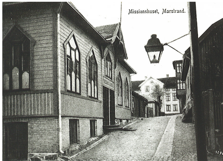
Missionshuset till vänster och i fonden Kvarngatan 9