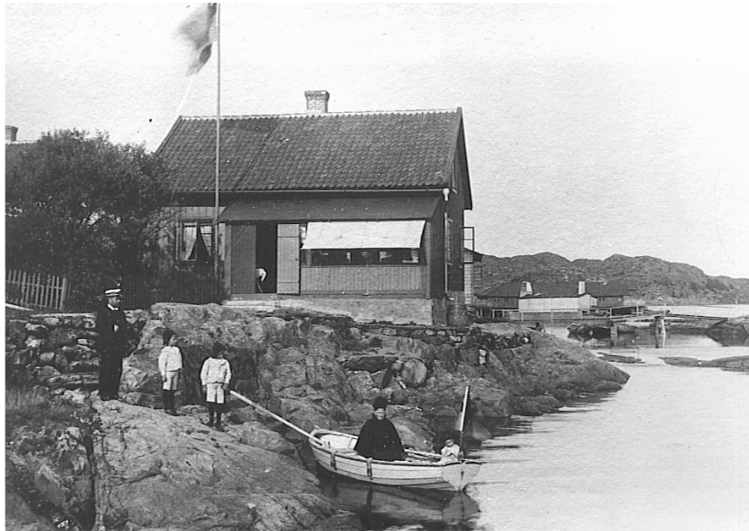
Nicanderska huset cirka 1908.