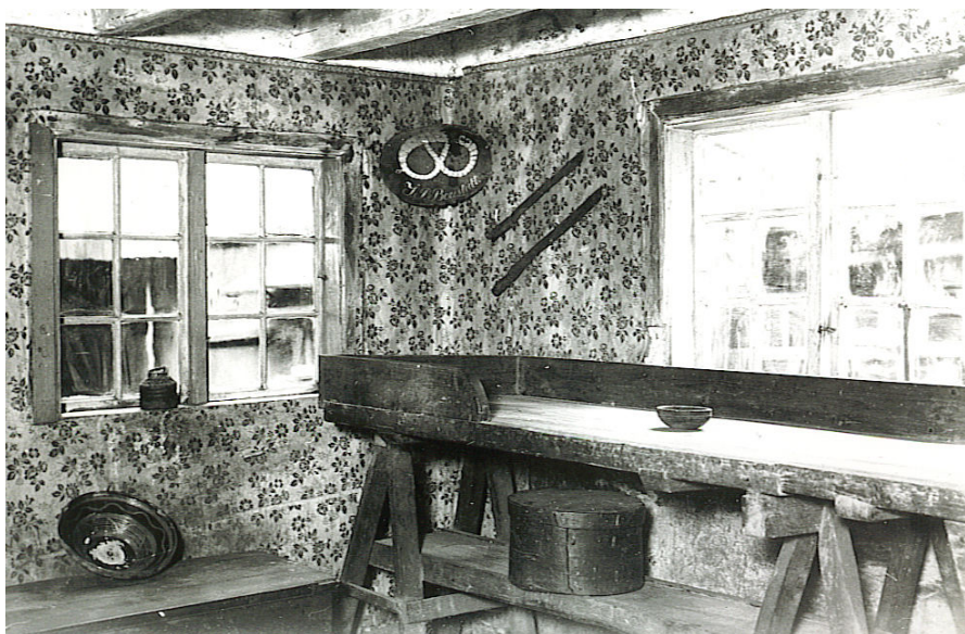
Kronobageriets lokaler Långgatan 5-7 före rivning 1927