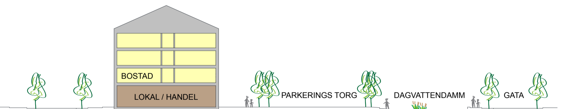
Kombinerad användning bostad/handel.