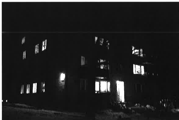
Har du hittat inte fungerar