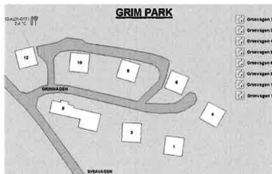
Karta på Eniro