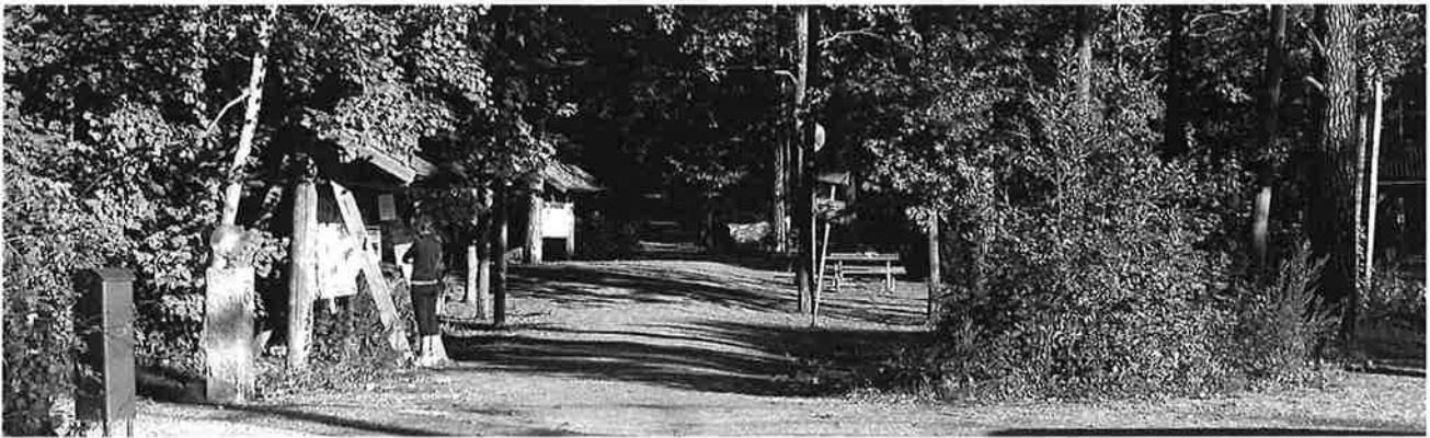
Ett idylliskt område i Djursholm