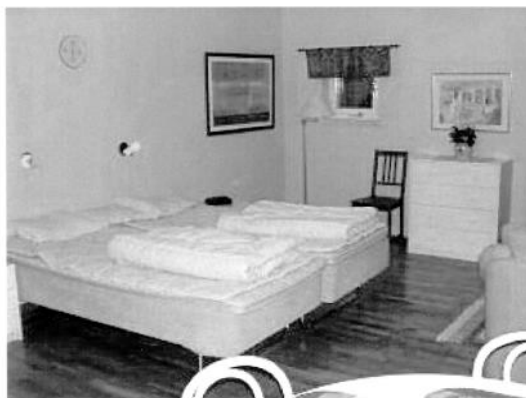
Brf Svartviks gästlägenhet på Svartviksslingan 17