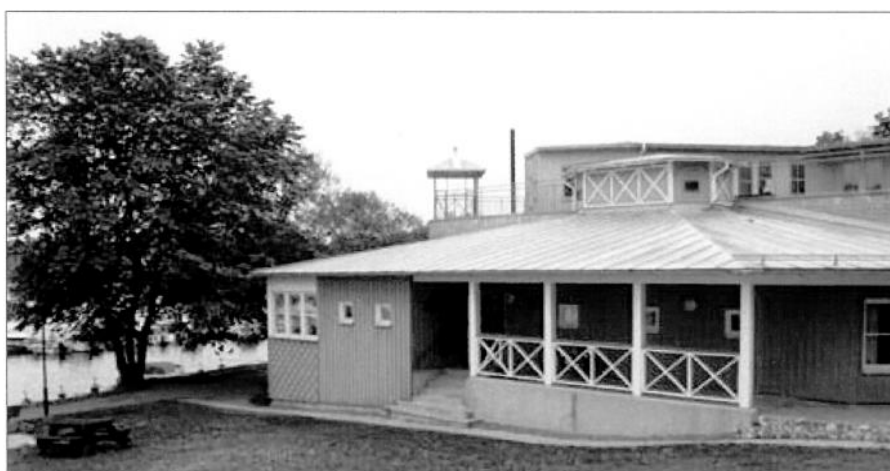
Båtviken ligger på Svartviksslingan 81

Expeditionstider hos Minnebergsseniörerna: