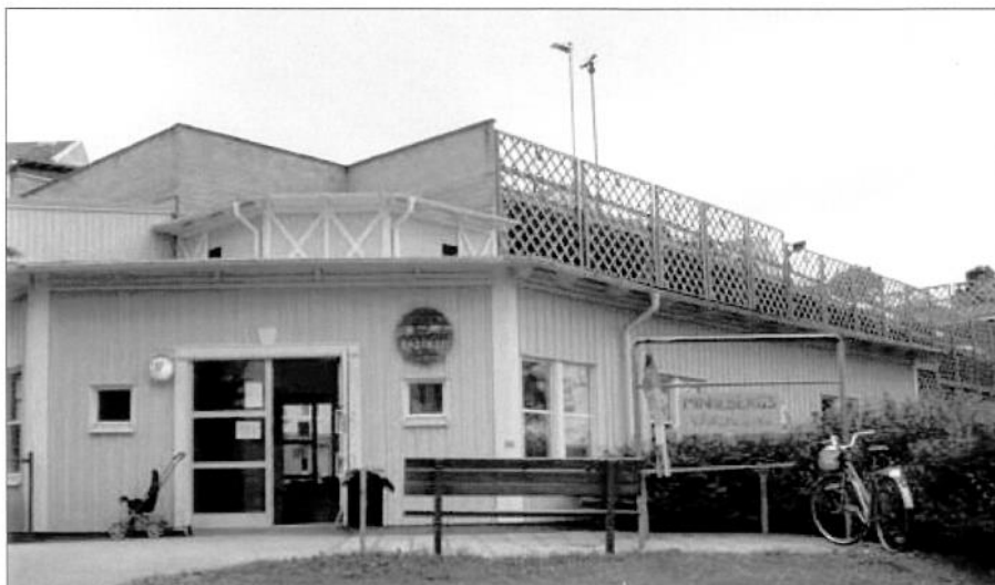
Badviken ligger på Svartviksslingan 17

Bokning av lokalerna sker genom Minnebergsseniörerna som har sin expedition på Svartviksslingan 59.