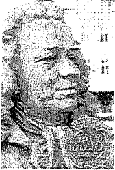
Brf Alströmer Alingsås